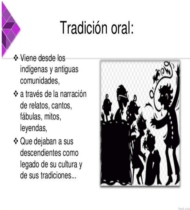
IMAGEN 5 CUADRO GRAFICO: LITERATURA Y TRADICIÓN