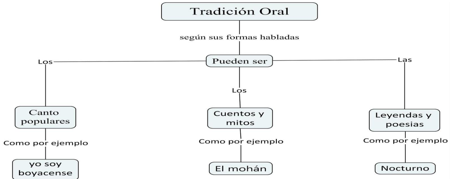
IMAGEN 7 CUADRO SINOPTICO: TIPOS DE MITOS