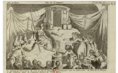
El culto de la «diosa Razón» en Notre Dame. 1793. Aguafuerte. 12 x 20 cm.

Los artistas y escritores neoclásicos veían a la Razón como una diosa garante del orden civilizatorio. El racionalismo en la composición estética, es decir, la representación organizada y metódica, así como los temas que resaltaban la templanza, la virtud y el autodominio, eran una forma de ejercer y difundir el culto a la razón.