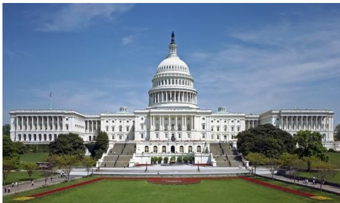
William Thornton y otros: Capitolio de los Estados Unidos . 1793-1800.