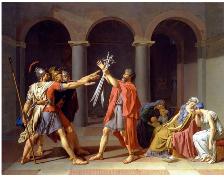
Jacques-Louis David: El juramento de los Horacios . 1784. Óleo sobre lienzo. 3,26 m x 4,2 m.

Tres procesos históricos fueron claves en el movimiento neoclásico: