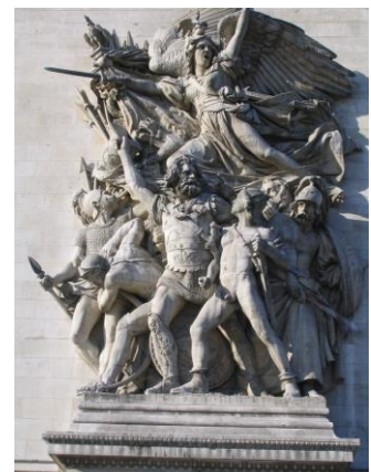
François Rude: La Marsellesa , 1833. Grupo escultórico de una de las caras del Arco de Triunfo de París.

El arte neoclásico abordaba especialmente temas como la historia grecolatina (modelos morales), la historia del republicanismo y de la revolución francesa y la mitología romana (como alegoría de la virtud). Seguían existiendo igualmente los géneros del retrato individual y colectivo. Junto a esto, persistían algunos otros temas de menor interés en la escala de valores del movimiento. Por ejemplo, la pintura religiosa de inspiración cristiana.