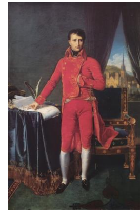
Ingres: Napoleón Bonaparte . 1804. Óleo sobre lienzo. 227 x 147 cm.

Equilibrio, proporción y simetría fueron entendidos como metáfora formal del carácter moral, es decir, pretendían simbolizar, por medio de la forma, el código de valores de la civilización moderna. Este canon se aplicó en las artes plásticas, la música, la arquitectura y la literatura.