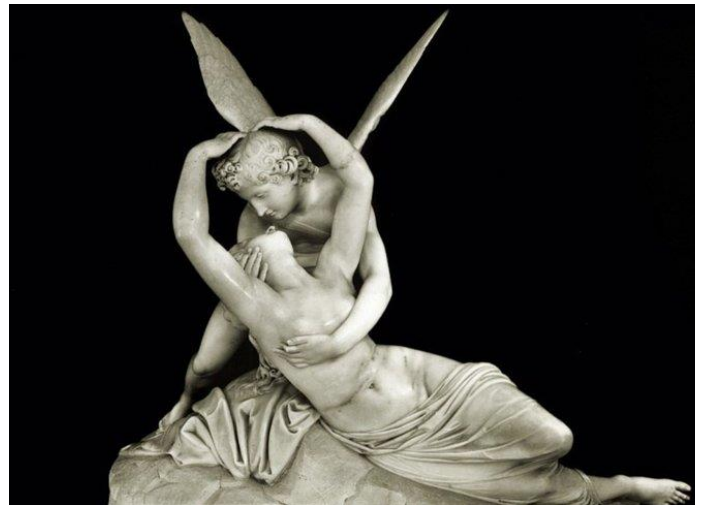
Antonio Canova: Eros y Psique . 1787-1793. Mármol. 155 cm x x 168 cm.