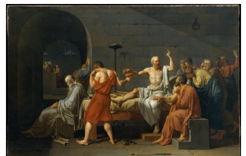
Jacques-Louis David: La muerte de Sócrates . 1787. Óleo sobre lienzo. 129,5 x 196,2 cm

El propósito y fin del neoclasicismo era la educación y la moralización de la sociedad con miras a la construcción del proyecto moderno. Los artistas y escritores creían que a través de sus obras ayudaban a difundir los valores necesarios para construir una sociedad racional, moral, culta y progresista que superara la ignorancia, a la que veían como madre de la intolerancia y el dogmatismo.