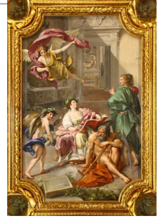
Anton Raphael Mengs: El triunfo de la historia sobre el tiempo . 1772. Óleo sobre lienzo.