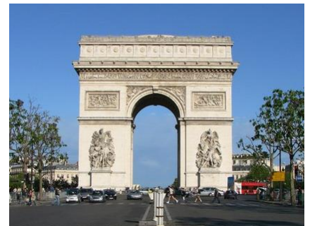
Jean-François-Thérèse Chalgrin: Arco de Triunfo de París . 1806-1836. 50 metros de altura, 45 metros de ancho y 22 metros de profundidad.

Paradójicamente, el nacionalismo emergente de aquellos años aspiraba a la universalidad, que se expresara en la inclusión de todas las civilizaciones en una narrativa racionalista o, al menos, en la conformación de un Estado nacional laico y republicano de vocación universal, que acogiera por igual a todos los ciudadanos.