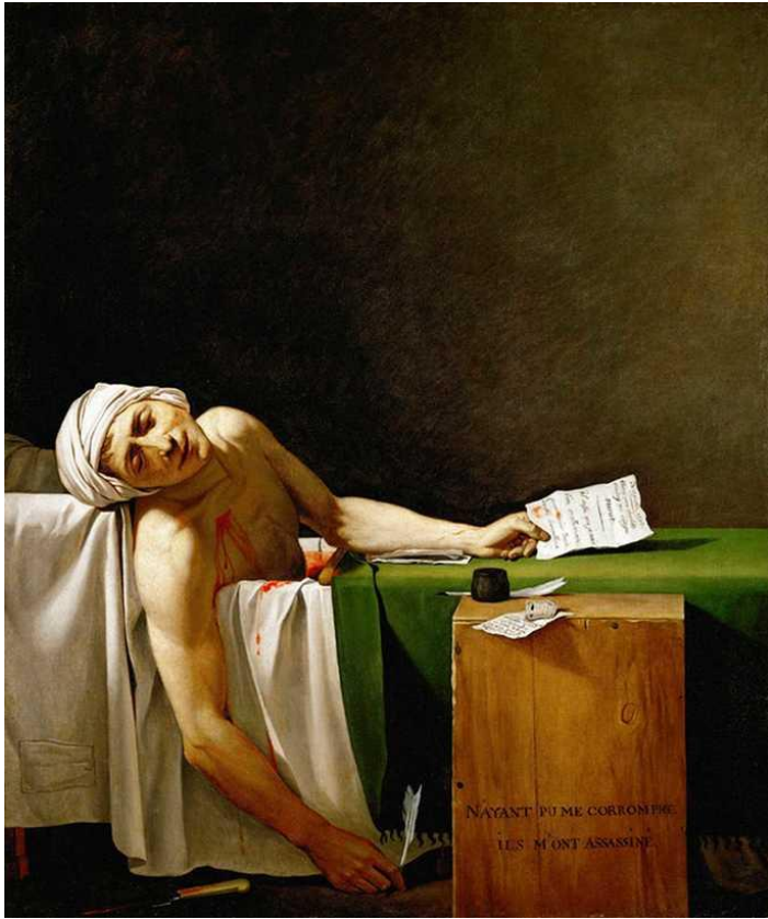
Jacques-Louis David: La muerte de Marat . 1793. Óleo sobre lienzo. 1,62 m x 1,28 m.

La pregunta sería, sin embargo, ¿cómo se expresó todo esto en cada una de las disciplinas artísticas? Veamos a continuación cuáles fueron las soluciones que los artistas y escritores neoclásicos encontraron en la pintura, la escultura, la arquitectura.