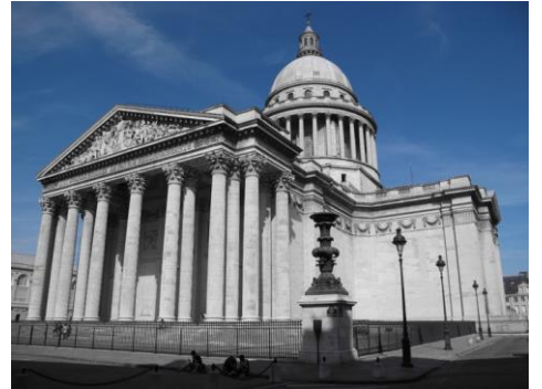
Jacques-Germain Soufflot: Panteón de París, antigua iglesia de santa Genoveva .

La inspiración en la Antigüedad Clásica ya se había visto en el Renacimiento, pero mientras los renacentistas acudían a ella como un método para conocer la naturaleza, los neoclásicos la interpretaban como una referencia moral en la cual fundar el "proyecto moderno". Se trataba, pues, de una idealización moral del pasado grecolatino.