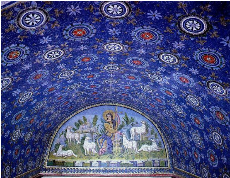
Ilustración 2: "El Buen Pastor" mosaico e interior del mausoleo de Gala Placidia. Rávena, Italia, 425-450

El otro gran edificio occidental es el baptisterio; su planta es circular o poligonal, inspirándose en modelos romanos. La pila suele estar en el centro y disponen de galerías bajas, separadas del espacio central por columnas. La circulación de los fieles implica esta disposición arquitectónica. Entre los más importantes baptisterios encontramos los de Constantino y Letrán en Roma o el Mausoleo de Santa Constanza en la misma ciudad o el baptisterio de Ravena. En oriente la arquitectura paleocristiana recibirá la influencia del helenismo y del arte mesopotámico. Los templos tienen planta de cruz griega -los brazos tienen la misma longitud- o son octogonales o circulares, al igual que los baptisterios. Las cubiertas más utilizadas serán las bóvedas y las cúpulas sobre pechinas. Buen ejemplo es la iglesia del monasterio de San Simeón el Estilita en Kalat Simán. Estas influencias llegarán a occidente a través del exarcado bizantino de Ravena, un foco oriental en pleno corazón de Italia. En Ravena se levantan el Baptisterio de los Ortodoxos, la tumba de Teodorico y el mausoleo de Gala Placidia.