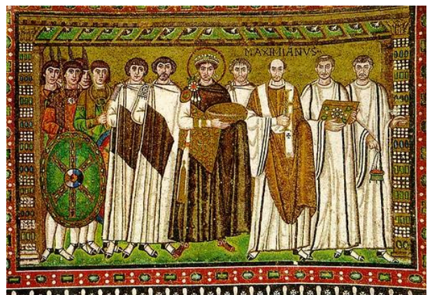
Ilustración 3: Mosaico de Justiniano en San Vital de Rávena. 546-548

"La evolución del arte paleocristiano motivará el nacimiento del Arte Bizantino. Pero la gran novedad estriba en que el arte Bizantino mantuvo también importantes rasgos de la cultura greco-latina, pudiendo considerarse un arte puente entre la antigüedad y el futuro Renacimiento. Bizancio apenas creó valores nuevos pero supo asimilar y fundir las influencias que llegaron desde oriente y occidente. Grabar considera al arte bizantino el "cristiano por excelencia, por su seriedad devota y solemne, por su apartamiento del mundo". Entre los siglos V y VII se desarrollará la llamada Primera Edad de Oro bizantina, relacionada con la obra de Justiniano .